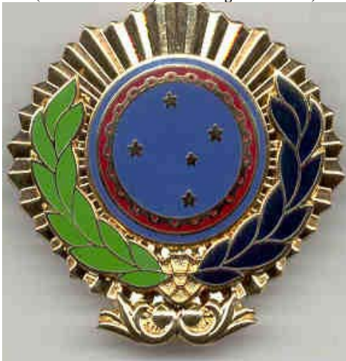
Distintivo do CAEPE (Decreto Nº 28503, de 14 de agosto de 1950)