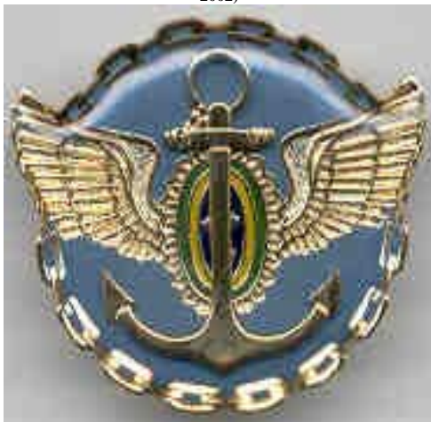
Distintivo do CEMC (Portaria Nº 518/DPE/SPEAI/MD, de 09 de setembro de 2002)