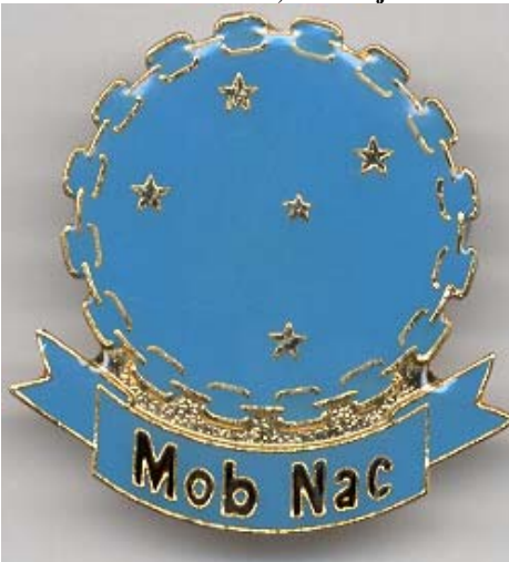
Distintivo do CLMN (Portaria Nº 477/SPEAI/MD, de 31 de janeiro de 2000)