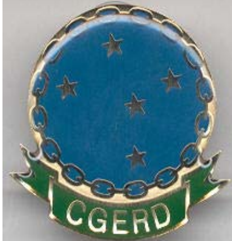
Distintivo do CGERD (Portaria N° 911/DESF/SEC/MD, de 25 de setembro de 2003)