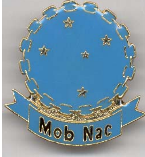
Distintivo do CLMN (Portaria N° 477/SPEAI/MD, de 31 de janeiro de 2000)