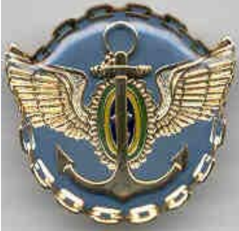
Distintivo do CEMC (Portaria N° 518/DPE/SPEAI/MD, de 09 de setembro de 2002)