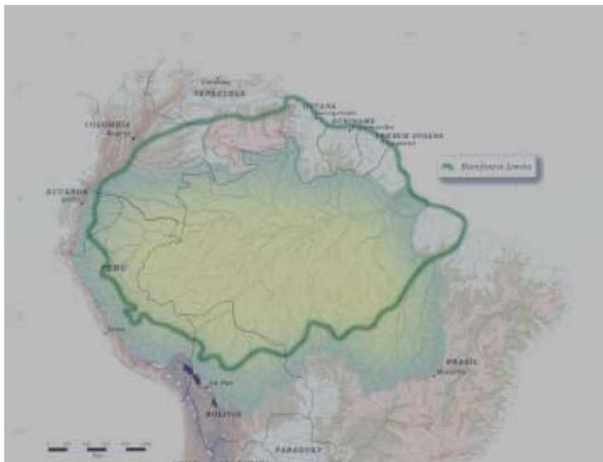
A Floresta Tropical Amazônica - Rainforest

A floresta tropical Amazônica é o mais rico ecossistema do planeta, já que existe uma estreita correlação entre a dimensão do ecossistema e do número de espécies, tornando a Amazônia genericamente aceita como a maior fonte de biodiversidade e o maior banco de germoplasma do mundo.