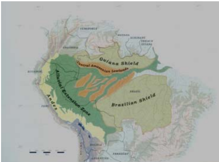
Principais Zonas Ecológicas da Bacia Amazônica

Os escudos amazônico e guianense, separados pelo Rio Amazonas a leste, constituem metade da Amazônia, sendo a outra metade constituída por uma gigantesca bacia sedimentar, ocupando, aproximadamente, 35% da rede de drenagem. O depósito dos sedimentos foi de tal monta que as terras baixas sedimentares afundaram sob seu próprio peso, tendo sido registrados sedimentos em até 5.000 metros de profundidade.