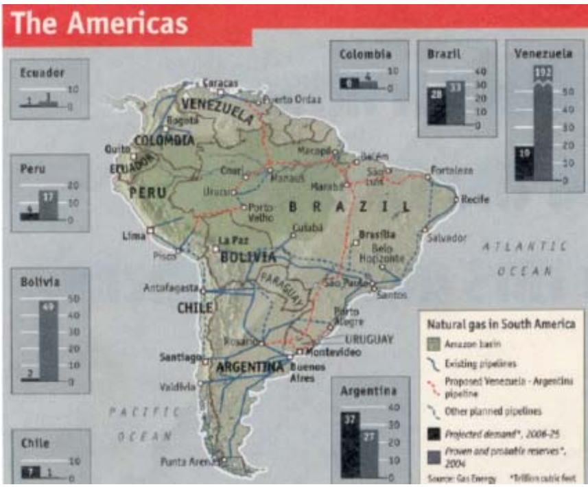
Fig. 1 - The Economist 11 de fevereiro 2006

As ofertas do gás boliviano, peruano e de outros países sul-americanos, os elevados custos do projeto, as condições econômicas, bem como o endividamento dos países sul-americanos, o tempo de execução do projeto e a relação custo benefício, nesse período, podem vir a afetar o projeto. Dependendo de como se desenvolver a comercialização do gás boliviano e peruano, o projeto do gasoduto pode vir a ter sua proposta alterada, na forma inicialmente pretendida.